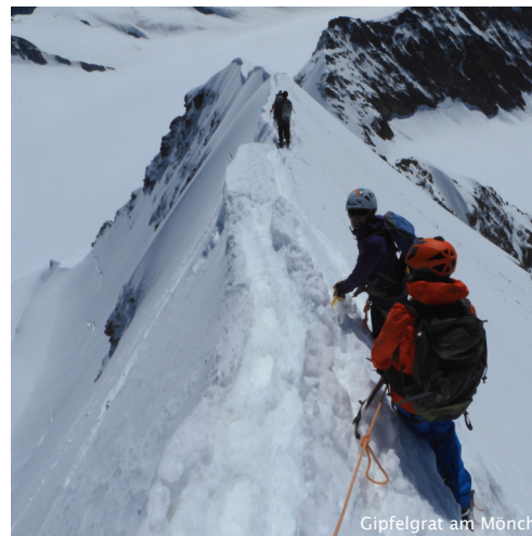
Gipfelgrat am Mönch

Bergführer inkl. allen Spesen; Organisation, Vorbereitung; Übernachtung mit Halbpension in der Mönchsjochehütte; Tourentee.