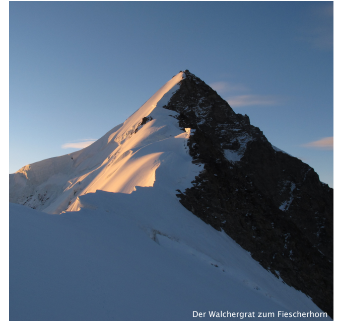
Der Walchergrat zum Fiescherhorn