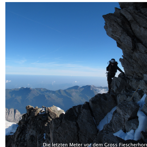
Die letzten Meter vor dem Gross Fiescherhorn

BESCHRÄNKTE TEILNEHMERZAHL – „ES HET SOLANGS HET...“