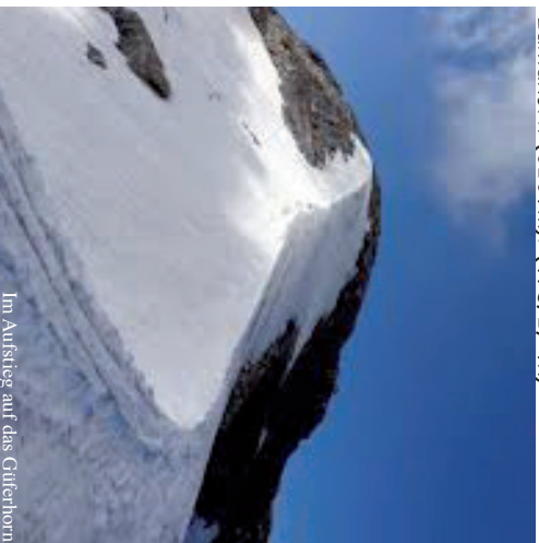
Im Aufstieg auf das Güferhorn

Piz Cassioi (3128m): Unbekannter Gipfel Westlich der Läntahütte. (WS: 4.5h)